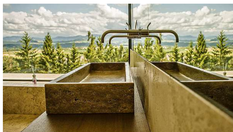
Naturstein – so wird der Sanitärbereich ein Glanzstück.

Casa Sasso Steinmetz GmbH Das Haus der Steine Untere Landstr. 20, 4055 Pucking Tel. 07229 / 79 8 60 office@casa-sasso.at www.casa-sasso.at