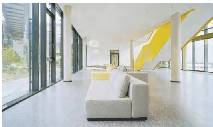
Trendig mit Beton geschliffen.

Von schlichter Eleganz bis trendig mit Cemento: Auch in Sachen Farbgestaltung ist Beton geschliffen schier unbegrenzt. Der Bogen spannt sich von schlichter Eleganz bis zu trendig-poppig und für die moderne Architektur bestens geeignet. Gerne berät Sie das Team von Casa Sasso diesbezüglich.