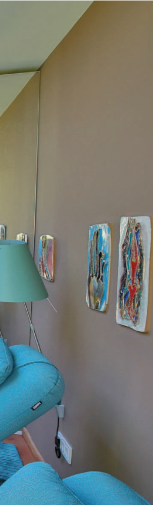
Entspannen mit Naturstein: Travertin Classico kombiniert mit Noce.